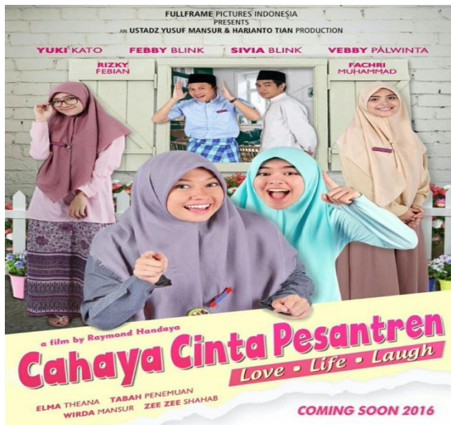
Gambar 1: Film Cahaya Cinta Pesantren

Adapun dalam ayat di atas tidak di amalkan oleh anak pesantren di dalam film tersebut.