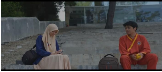
Gambar 2: Laki-Laki dan Perempuan Berduaan

Diantara pemuda dan pemudi yang belum ada ikatan halal sangat di larang untuk berkirim surat apalagi di dalam surat tersebut mengandung makna cinta karena hal tersebut akan membawa seseorang kepada zina hati yaitu merasakan. artinya perasaan yang terlintas di dalam hati dan pikiran bisa menjadi sumber kebaikan maupun keburukan.