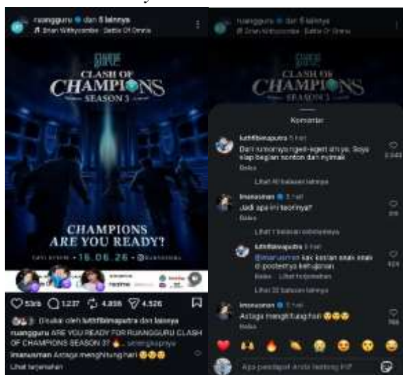
Gambar 2. Aspek Internet Porosity Ruangguru.