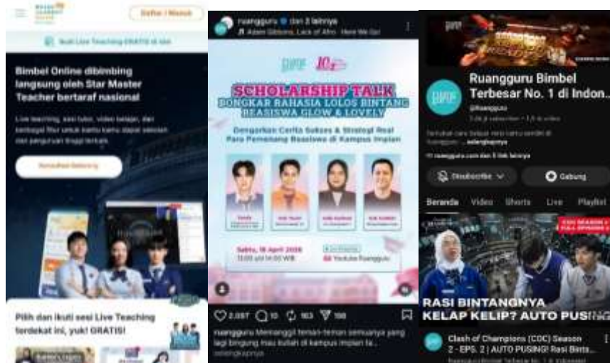
Gambar 3. Platform Ruangguru.