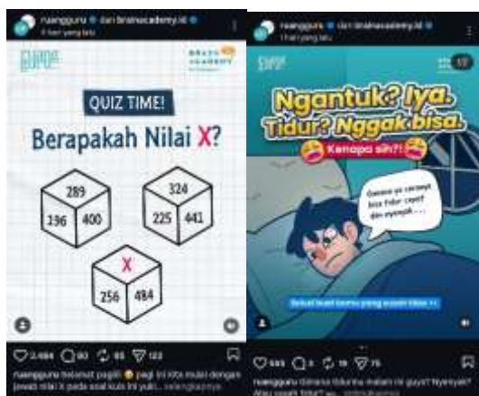
Gambar 4. Aspek Richness in content and reach Ruangguru.