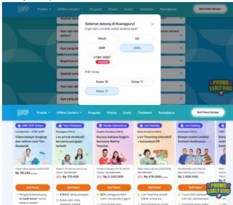
Gambar 1. Aspek Transparency Ruangguru.