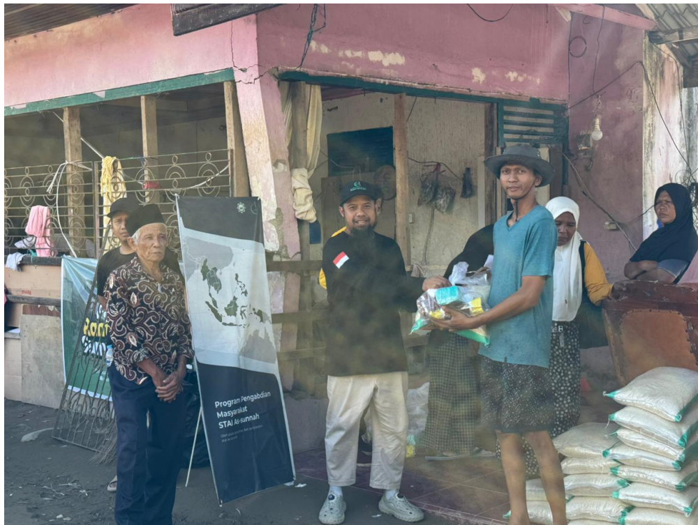
Gambar 1. Penyerahan paket sembako dari tim STAI As-Sunnah kepada penerima manfaat. Tampak standing banner STAI As-Sunnah menunjukkan transparansi sumber dana dan identitas pelaksana kegiatan.

Kondisi infrastruktur juga mengalami kerusakan parah. Akses jalan utama menuju Batu Busuak mengalami kerusakan total dengan pangkal jembatan yang tergerus air, menyebabkan isolasi wilayah selama beberapa hari. Jaringan listrik dan telekomunikasi juga terganggu, mempersulit koordinasi evakuasi dan bantuan. Meskipun pemerintah telah melakukan upaya pemulihan dengan mengerahkan alat berat dan Tim Reaksi Cepat, pada saat tim pengabdian tiba di lokasi, kondisi jalan masih sangat sulit dilalui terutama untuk kendaraan besar.