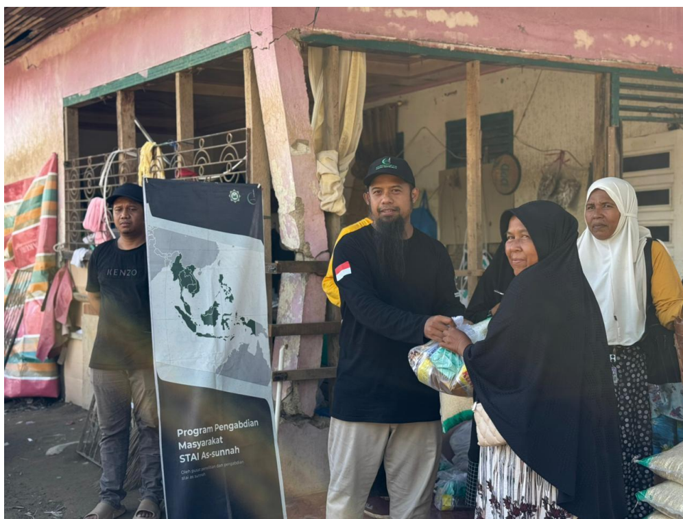
Gambar 2. Distribusi door-to-door kepada lansia dan keluarga yang kesulitan mobilitas. Terlihat kondisi rumah yang sederhana dengan kerusakan akibat banjir di latar belakang, menunjukkan pentingnya metode distribusi yang adaptif sesuai kondisi penerima.

Transparansi dan akuntabilitas menjadi prinsip utama dalam pelaksanaan distribusi. Setiap penerima bantuan dicatat namanya dalam daftar penerima yang dibuat secara manual di lapangan. Tim juga membawa spanduk besar bertuliskan "Dari Rakyat Indonesia - Melalui Humanities Project" untuk menunjukkan bahwa dana bantuan berasal dari masyarakat Indonesia melalui program kemanusiaan, bukan dari sumber tertentu semata. Standing banner STAI As-Sunnah juga dipasang di setiap lokasi distribusi untuk transparansi identitas pelaksana kegiatan.