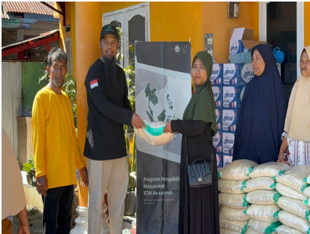
Gambar 3. Detail paket bantuan sembako berupa beras, air mineral, dan kebutuhan pokok lainnya. Standing banner Program Pengabdian Masyarakat STAI As-Sunnah menunjukkan identitas institusi pelaksana sebagai bagian dari implementasi Tri Dharma Perguruan Tinggi.

Meskipun demikian, respons masyarakat terhadap kegiatan pengabdian ini sangat positif. Warga menyambut kedatangan tim dengan antusias dan rasa syukur yang mendalam. Banyak yang menyampaikan terima kasih tidak hanya untuk bantuan material yang diterima, tetapi juga untuk perhatian dan kepedulian yang ditunjukkan. Kehadiran tim dari luar daerah, apalagi melibatkan kemitraan internasional dengan Singapura, memberikan pesan kuat bahwa mereka tidak sendirian dalam menghadapi kesulitan. Ada solidaritas kemanusiaan yang melampaui batas geografis dan nasional. 13