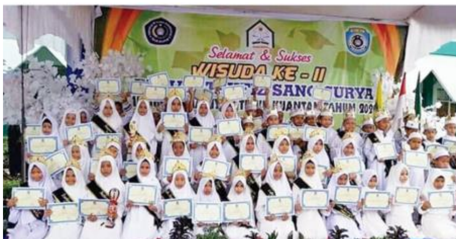
Gambar 1. Peserta Wisuda Tahfidz Rumah Tahfidz Sang Surya Teluk Kuantan

Selain adanya faktor penghambat dalam penerapan metode al-Qosimi pada pembelajaran tahfizhul Quran di rumah Tahfiz Sang Surya Perguruan Mu'alimin Muhammadiyah Teluk Kuantan, terdapat juga pendukung yang dimiliki oleh rumah tahfis Sang Surya diantaranya adalah. yakni adanya suasana kenyamanan yang baik, layaknya ustad yang pembimbing tahfiz, mereka merupakan guru yang memiliki hapalan yang banyak serta amat faham terhadap metode yang digunakan yakni metode Al-Qosimi, kemudian di rumah Tahfis Sang Surya memiliki target yang setiap santri harus mencapainya, hal membantu Santri dan santriyah untuk menjalankan programnya dengan menargetkan setiap anak untuk hafal maksimal 1 juz dalam 1 smemster.